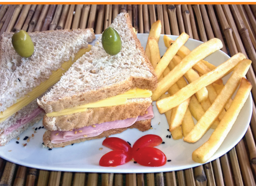
Misto R$ 30,00 (ham and cheese) com fritas