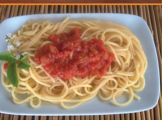
Espaguete R$ 30,00 com molhinho de tomate