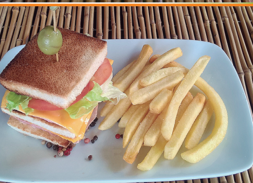
Americano R$ 32,00 (ham, cheese, egg and lettuce)