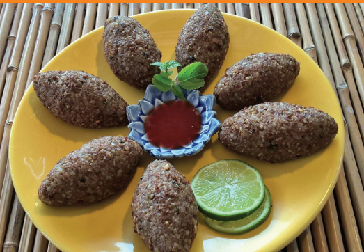
Kibe frito R$ 42,00 (7 unidades)