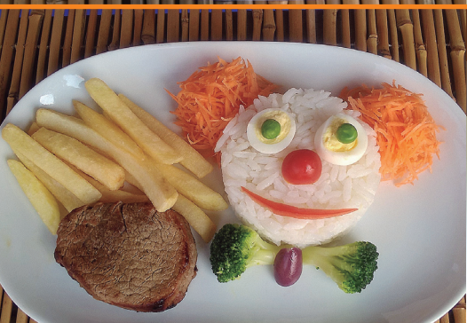
Carinha R$ 34,00 arroz, saladinha e fritas