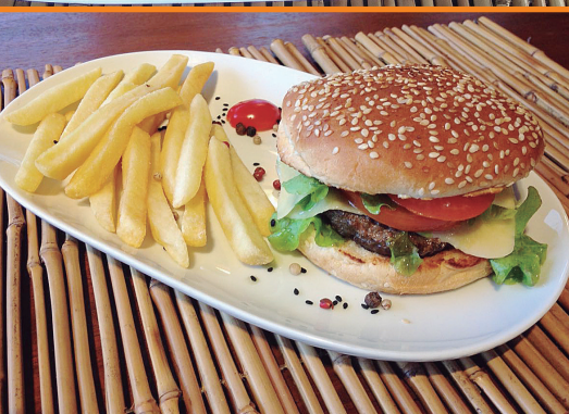
X - Burguer R$ 34,00 (de verdade!!) com fritas