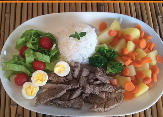
Carninha com legumes R$ 34,00 arroz, legumes e saladinha