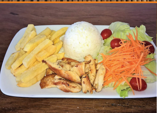
Franguinho R$ 34,00 arroz, fritas e saladinha