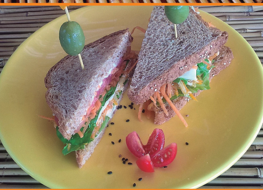
Natural R$ 32,00 (frango, queijo branco, tomate, alface)