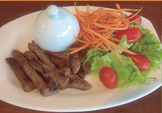
Tirinhas de carninha R$ 34,00 arroz e saladinha